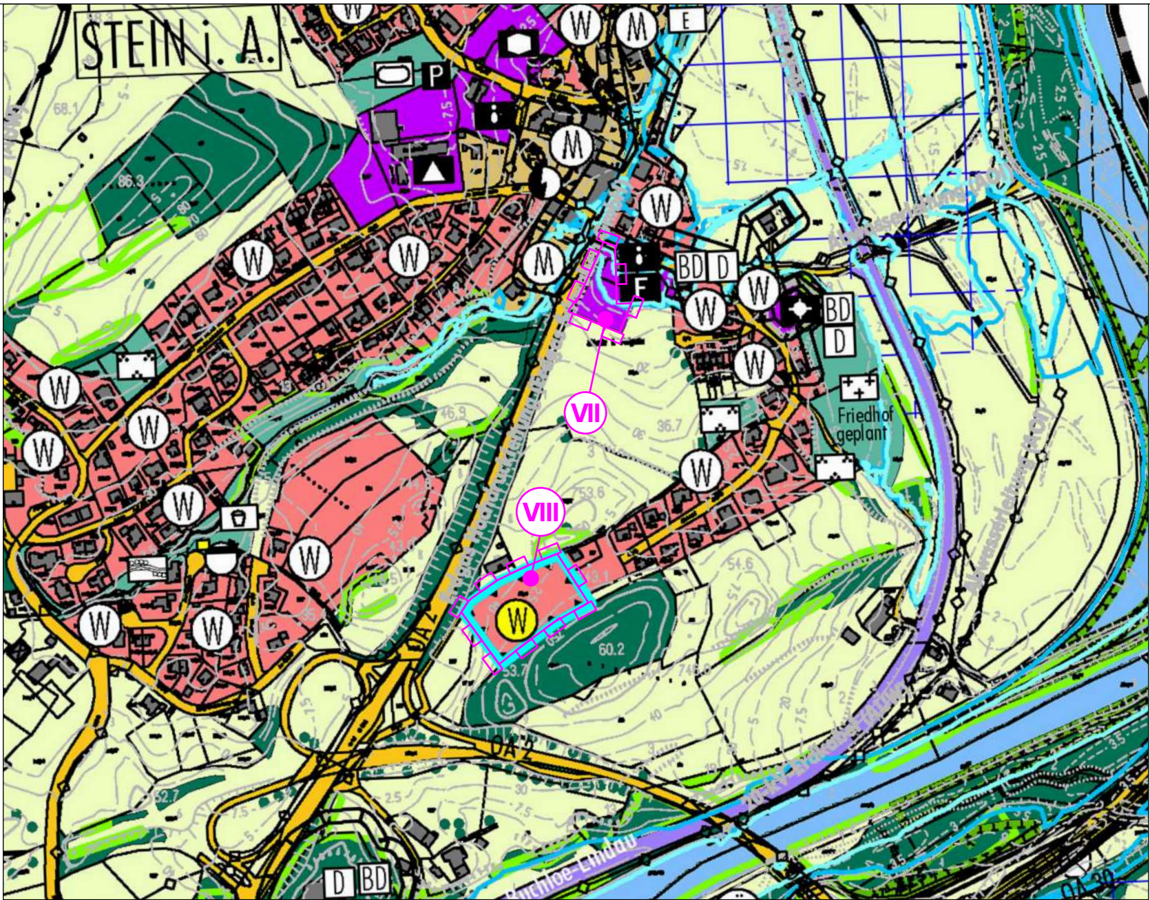
14. Änderung des Flächennutzungsplanes in 2 Bereichen im Ortsteil Stein i.A.